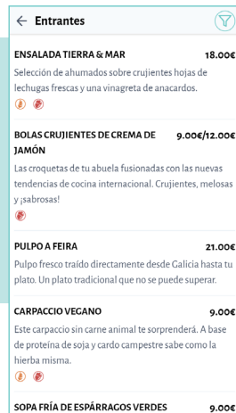
Listado de platos