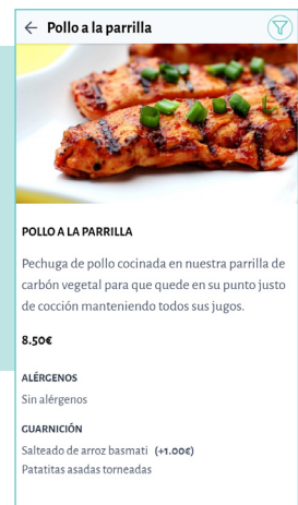
Presentación de plato con diferentes añadidos