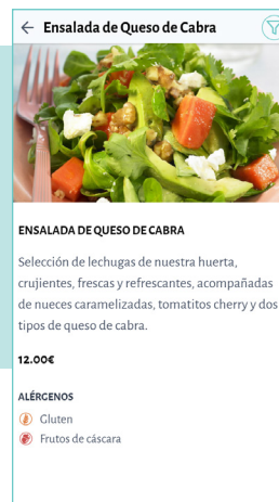
Presentación de plato con alérgenos